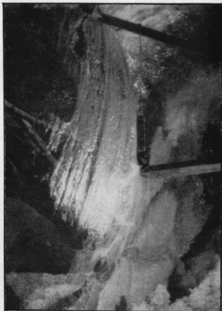
PL. X B. — Stries glaciaires sur un rocher de la rive gauche vu de l'amont; grotte sous-glaciaire.