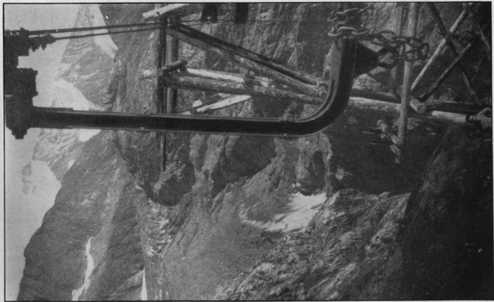
Pl. III A. — Glacier de Tré-la-Tête et Aiguille des Glaciers vus de Tête Noire (septembre 1941). Visa du Contrôle de Presse : 22/6/43.