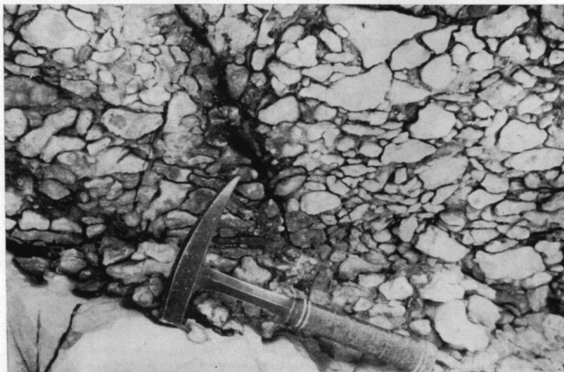
Fig. 1. — Base du niveau 2 dans la coupe du Claps de Luc (fig. 1 dans le texte). Eléments très irréguliers et extrêmement serrés.